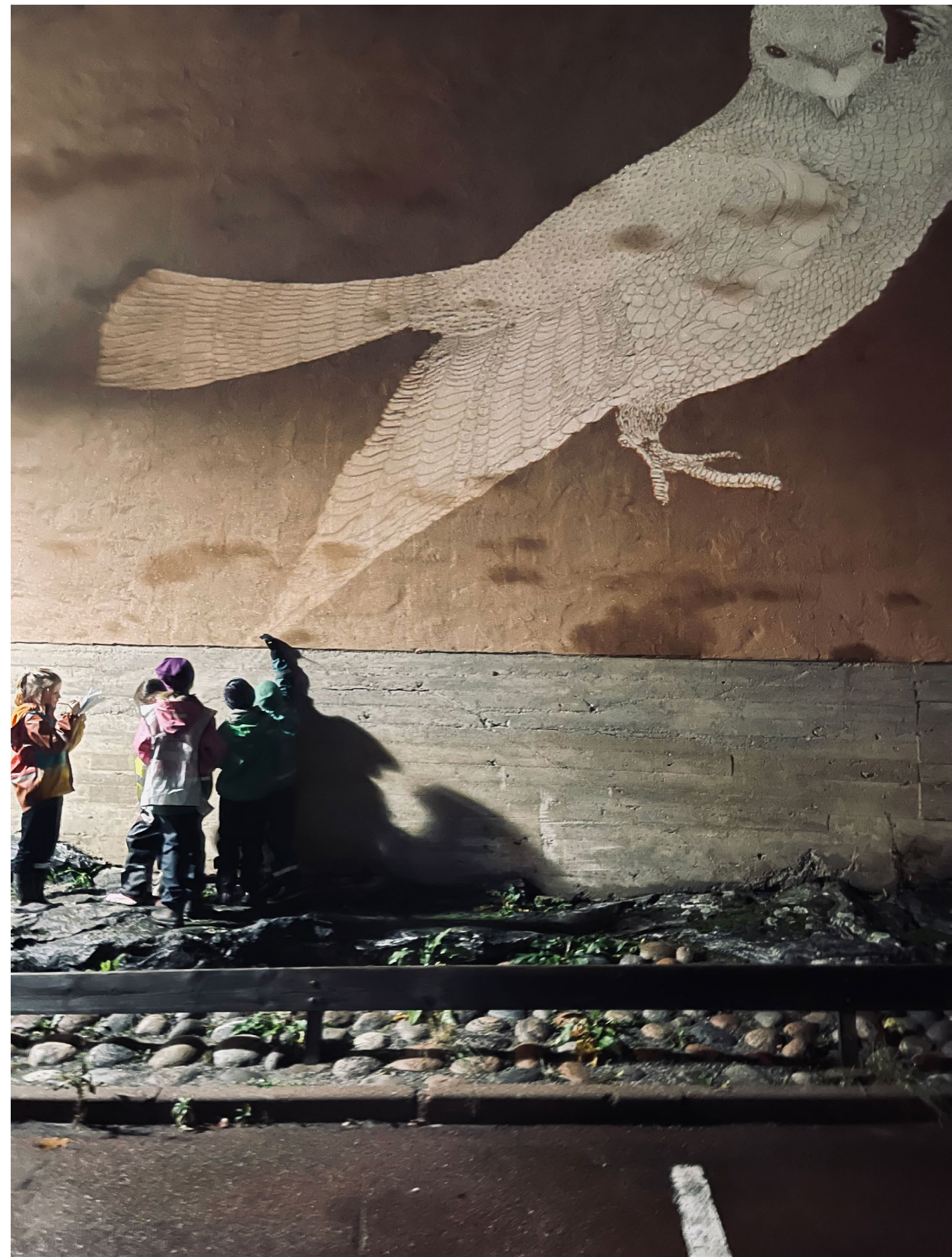
Toivo/Hope , Ainu Palmu Arvika Ljus!

Prosenttiperiaate ja rahoitus (TAIKE) 13.10.